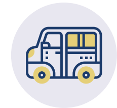
AUSFLÜGE (KILIANI, WEIHNACHTSMARKT, BIERGÄRTEN)