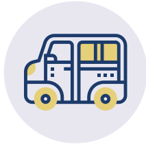
AUSFLÜGE (KILIANI, WEIHNACHTSMARKT, BIERGÄRTEN)