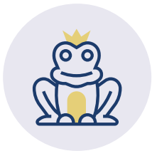
MÄRCHEN UND DEMENZ ©