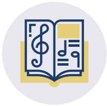
GEMEINSAMES SINGEN UND MUSIZIEREN