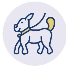
TIERISCHE MIT-BEWOHNER UND HUNDEBESUCHE

Hier geht es sehr familiär und herzlich zu. Doch jede Bewohnerin kann sich auch in ihr eigenes Reich zurückziehen. Viele haben ihre persönlichen Räume mit eigenen Bildern und Kleinmöbeln ausgestattet. Alle Zimmer haben seniorengerechte Möbel, Telefon- und Fernsehanschluss. Und natürlich gibt es einen Notrufknopf.