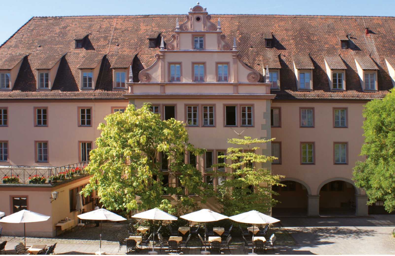
Bürgerspital Stammhaus Theaterstraße mit Weinhaus und Glockenspiel