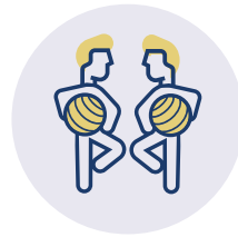
FÖRDERUNG DER BEWEGLICHKEIT