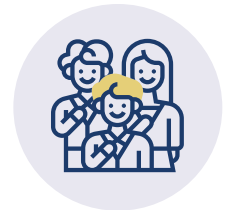
GRUPPEN- UND EINZELAKTIVITÄTEN