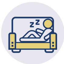
MITTAGSPAUSE MIT LIEGEMÖGLICHKEIT