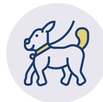
TIERISCHE MIT- BEWOHNER UND HUNDEBESUCHE