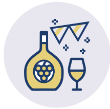
FESTE IM KULTURELLEN JAHRESVERLAUF