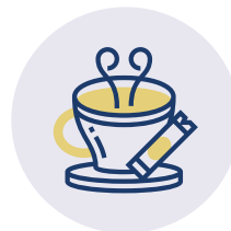
KAFFEE UND KUCHEN