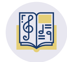
NACHMITTAGSPRO- GRAMM MIT Z.B. SPIELEN, GEDÄCHT- NISTRaining, GESPRÄCHSRUNDEN