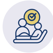
NACH BEDARF MEDIZINISCHE / PFLEGERISCHE MASSNAHMEN