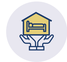
INSGESAMT 150 PLÄTZE